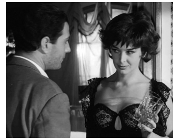
1959 L'EMPLOYÉ (L'Impiegato) de Gianni Puccini avec Nino Manfredi