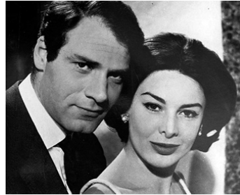
1960 ACCORD FINAL (Schlußaccord) de Wolfgang Liebeneiner avec Christian Marquand