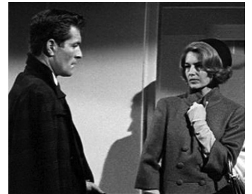
1964 ASSASSINAT À ROME (Il Segreto del vestito rosso) de Silvio Amadio avec Hugh O'Brian