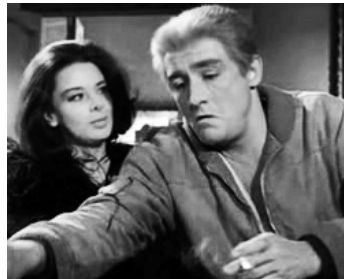
1964 PARLONS FEMMES (Se permette parliamo di donne) d'Ettore Scola avec Vittorio Gassman