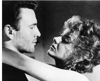
1961 CHASSE À LA DROGUE (Caccia all'uomo) de Riccardo Freda avec Umberto Orsini