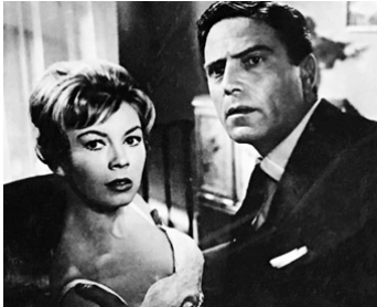
1960 LA GARÇONNIÈRE (Flagrant délit) de Giuseppe De Santis avec Raf Vallone