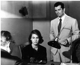
1955 FEMMES ENTRE ELLES (Le Amiche) de Michelangelo Antonioni avec G. Ferzetti