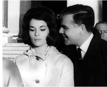
1962 TERREUR DANS LA NUIT (Der Teppich des Grauens) de Harald Reinl avec Werner Peters