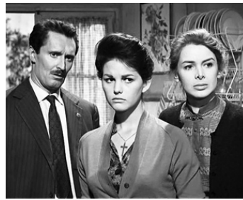
1959 MEURTRE À L'ITALIENNE (Un Maledetto Imbrogljo) de P. Germi avec C. Cardinale