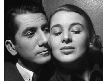
1953 L'AFFAIRE MAURIZIUS de Julien Duvivier avec Daniel Gélin