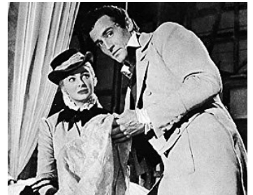
1956 KEAN (Kean, genio e sregolatezza) de et avec Vittorio Gassman