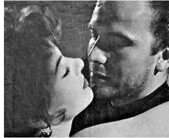
1952 PANIQUE À GIBRALTAR (I sette dell'orsa maggiore) de Duilio Coletti avec Pierre Cressoy