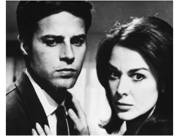
1962 LE TUEUR À LA ROSE ROUGE (Hipnosi) d'Eugenio Martin avec Jean Sorel