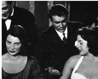
1955 FEMME SEULE (Donne sole) de Vittorio Sala avec Gianna Maria Canale, Ettore Manni