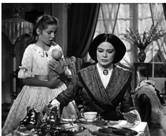
1965 LA CASE DE L'ONCLE TOM (Onkel Toms Hütte) de Geza von Radvanyi avec C. Cayatano