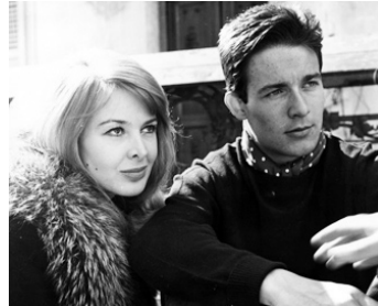
1961 LE COMMANDO TRAQUÉ (Tiro al Piccione) de Giuliano Montaldo avec Jacques Charrier