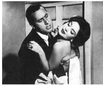
1959 BRÈVES AMOURS (Vacanze d'Inferno) de Camillo Mastrocinque avec Alberto Sordi