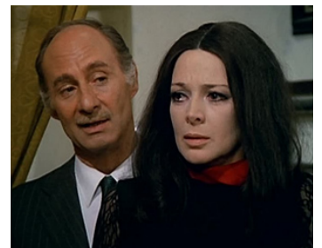
1970 LIBIDO (Nelle Pieghe della Carne) de Sergio Bergonzelli avec Emilio Guttierrez