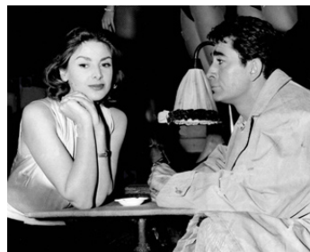
1958 LE FRIC de Maurice Cloche avec Jean-Claude Pascal