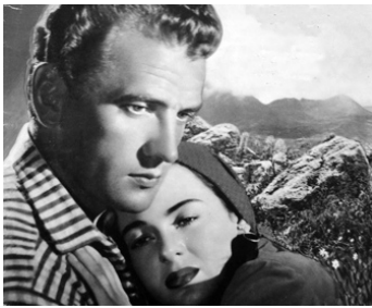
1949 CET AMOUR ÉTERNEL (Altura) de Mario Sequi avec Massimo Girotti