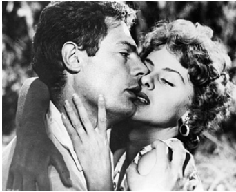
1951 SENSUALITÉ (Sensualità) de Clemente Fracassi avec Marcello Mastroianni