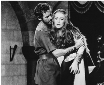
1961 LE GLAIVE DU CONQUÉRANT (Rosmunda e Alboino) de C. Campogalliani avec Guy Madison