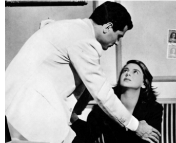
1953 VÊTIR CEUX QUI SONT NUS (Vestire gli ignudi) de Marcello Pagliero avec G. Ferzetti