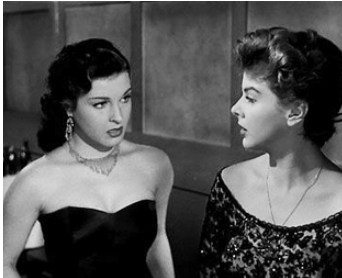
1952 LA TRAITE DES BLANCHES (La Trattata delle Bianche) de L. Comencini avec Silvana Pampanini