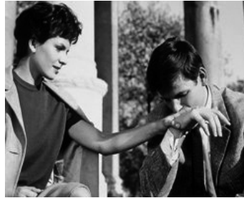
1962 L'AMOUR À VINGT ANS de Renzo Rossellini avec Geronimo Meynier