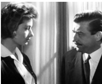
1957 TOUS PEUVENT ME TUER d'Henri Decoin avec François Périer