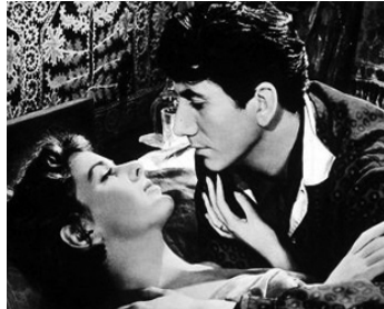
1953 L'ESCLAVE d'Yves Ciampi avec Daniel Gélin