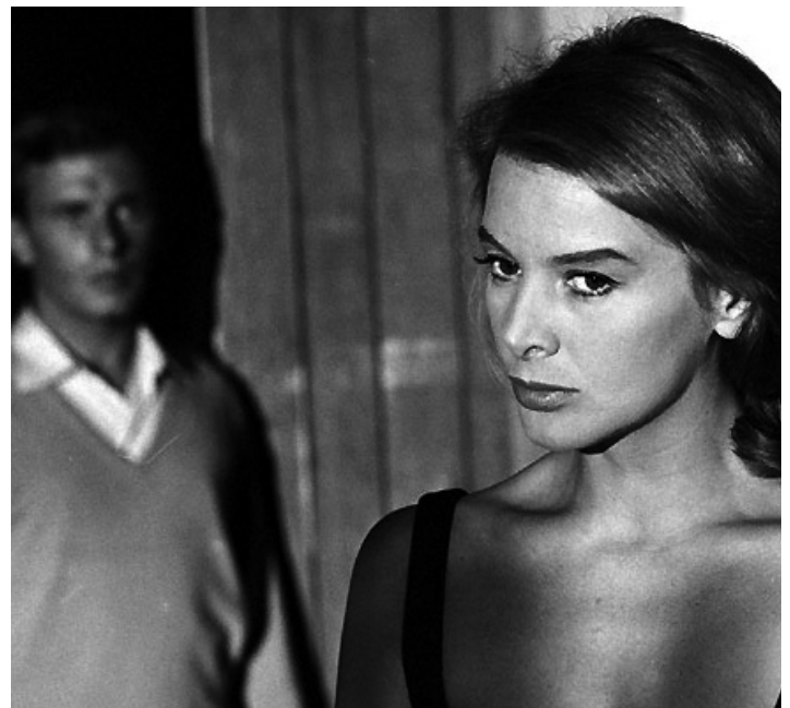
1958 ÉTÉ VIOLENT (L'Estate violenta) de Valerio Zurlini avec Jean-Louis Trintignant