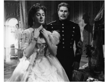
1952 AMOUR ET JALOUSIE (La Flammata) d'Alessandro Blasetti avec Amedeo Nazzari