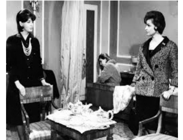
1961 ÂME NOIRE (Anima Nera) de Roberto Rossellini avec Nadja Tiller