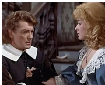
1957 LA TOUR PREND GARDE de Georges Lampin avec Jean Marais