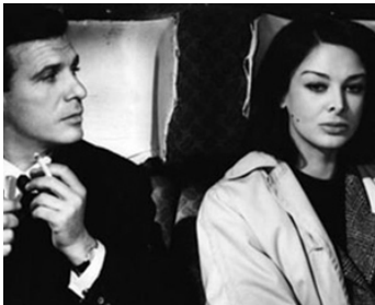
1963 EL DIABLO TAMBIEN LLORA de Jose A. Nieves Conde avec Francisco Rabal